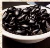
〈丹波園〉 丹波 黒豆煮 130kg限り 864円 (100gあたり) ■食料品 催物場