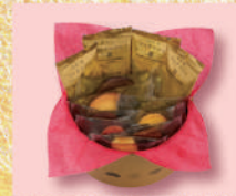
〈アンリ・シャルバンティエ〉 えびすガトー・キュイ・アソートS 1,728 円(10個入) ■洋菓子