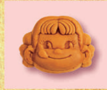
〈西洋菓子舗 不二家〉 ペコちゃん人形焼き(粒あん・ カスタード) 各216 円(1個) ■洋菓子