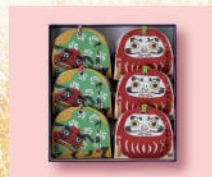
〈京菓匠 笹屋伊織〉おきあかり こぼし・獅子舞詰合せ 70点限り 1,728 円(2種6個入) ■和菓子