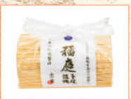
〈京家〉稲庭うどん 300点限り 1,188 円 (1kg)