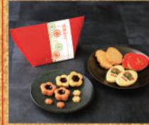
〈和楽紅屋〉お年賀ギフトBOX 1,801 円(8個入) ■洋菓子プロモーション

【お詫言】 印刷版の12月26日(火) 伊勢丹通信 赤特内の 商品に誤りがございました。 上記内容に訂正させて いただきます。