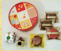
〈ブルミッシュ〉お正月BOX 36点限り 1,188 円(ミニトリュフケーキ・宇治抹茶の ミニトリュフケーキ・焼きチーズケーキ・ フィナンシェマロンx2/計6個入) ■洋菓子