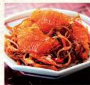
〈函館タナベ 食品〉数の子 松前漬 972円 (100gあたり) ■エスカーター 臨 特設会場