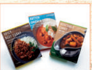
〈ISETAN MITSUKOSHI〉 THE FOOD カレー3種 セット 100セット限り 1,080 円 (3種1セット)