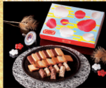
〈資生堂(パラー)〉ニューイヤーズスイ ーツ 100点限り 2,160 円(ショコラフォン x8・サブレx8・ラングドシャx8) ■洋菓子