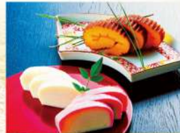
〈小田原/籠清〉たなごころ 各15点限り 各5,940円(紅・白/各270g/1本) あらたま 30点限り 5,940円(伊達巻/650g/1本) ■フーズマーケット