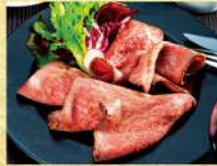
〈日進ハム〉 黒毛和牛 ローストビーフ モモ 各日10kg限り 1,620円 (100gあたり)★