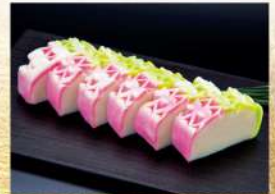
〈小田原/鈴廣〉 超特選蒲鉾古今鹿の子 30点限り 4,644円(280g/1本) ■フーズマーケット