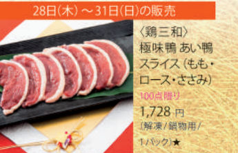
28日(木)～31日(日)の販売 〈鶏三和〉 極味噌鴨い鴨 スライス(もも・ ロース・ささみ) 100点限り 1,728 円 (解凍/保温用/ 1パック)★ ■フーズマーケット