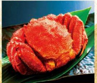
〈中島水産〉 北海道産他ポイル毛ガニ 8,999円 (解凍/特大/1杯)★