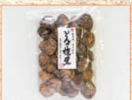
〈兼貞〉国産どんこ椎茸 100点限り 1,296 円 (100g)