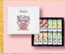
〈フランス〉迎春ミルフィユ 2,160 円(12個入) ■洋菓子