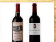
フランス・ボルドー・グレート ヴィンテージ・ホワイネ2本セット 40点限り 5,500 円 (各750ml/フランス製)