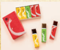
〈とらや〉干支小形羊羹5本入 干支柄化粧箱 1,620 円(夜の梅 おもちが各2本/新緑1本) ■和菓子