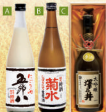
A 〈新潟県/菊水酒造〉 五郎八 冬季限定樽酒 900点限り 1,614 円(720ml) B 〈新潟県/菊水酒造〉菊水 しぼりたて生原酒 限定樽酒 500点限り 1,445 円(720ml) C 〈東京都/小澤酒造〉 澤乃井 大吟醸 原酒 96点限り 3,740 円(720ml)