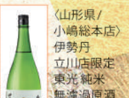
〈山形県/ 小嶋総本店〉 伊勢丹 立川店限定 東光 純米 無濾過原酒 500点限り 1,980 円 (18L)