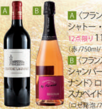
A 〈フランス・ボルドー〉 シャトー・ラグランジュ 20 12点限り 11,000 円 (赤/750ml/フランス製) B 〈フランス・シャンパーニュ/シャンパーニュBYフェル ナンド)ロゼ ブリュット エ スカパド 12点限り 8,800 円 (ロゼ発泡/750ml/フランス製)