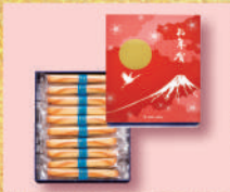
〈ヨックモック〉 シガール 1,728 円(20本入) ■洋菓子