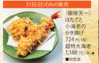
31日(日)のみの販売 〈銀座天一〉 ほたてと 小海老の かき揚げ 724 円(1枚) 超特大海老 1,188 円(1本)★ ■和惣菜