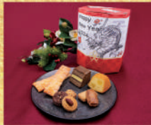
〈ロイスタール〉迎春BOX 2024 50点限り 1,620 円(アマンドリーフx7・ クッキーx12・アンリカx2) ■洋菓子