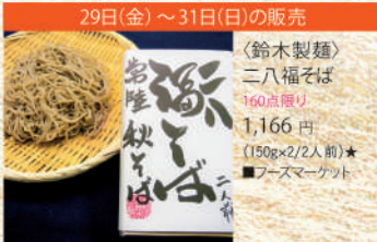
29日(金)～31日(日)の販売 〈鈴木製麺〉 二八福そば 160点限り 1,166 円 (150g×2/2人前)★ ■フーズマーケット