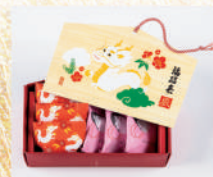
〈宗家 源吉兆庵〉絵馬福招来 1,620 円(干支羊羹x3・お多福画x3) ■和菓子