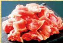
〈鶏三和〉 純鶏名古屋 コーチン もも雑煮用 886円 (100gあたり)★