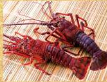
〈中島水産〉 三重県産他 伊勢海老 9,999円 (1尾)★