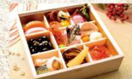
〈日本ばし大増〉 料理折詰「粹」 ご予約40点限り 9,180円 (18.6×18.6×4.9cm/1人前/ 重箱:木製) ■和菓室