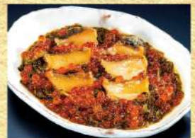
〈中村家〉三陸海宝漬 50点限り 5,001円(350g/1箱) ■フーズマーケット