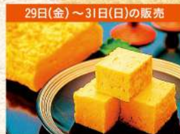
29日(金)～31日(日)の販売 〈築地/つぎぢ松露〉玉子焼 各日150点限り 1,296円(1本) ■フーズマーケット