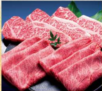
〈イセタンミート〉三重県産松阪牛5等級1頭 売り尽くし切落し 200kg限り 1,380円から (割つき焼用他/100gあたり)★ ●国産黒毛和牛ローストビーフ用モモブロック 各日30kg限り 1,280円(100gあたり)