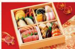
〈なだ万厨房〉 正月料理「業正月」 ご予約120点限り 15,120円 (22.2×22.2×5.4cm/2人前/ 重箱:紙・合成樹脂 (発泡ポリスチレン)製) ■食料品催物場

※おせちは配送不可、お持ち帰りのみとさせていただきます。※数に限りがございますので、品切れの際はご容赦ください。※お渡しは12月31日(日)のみとなります。※消費期限はすべて2024年1月1日(月・祝)となります。※各店にてご予約を承ります。当日販売については各店にお問い合わせください。※重箱のサイズ表記はすべて外寸です。