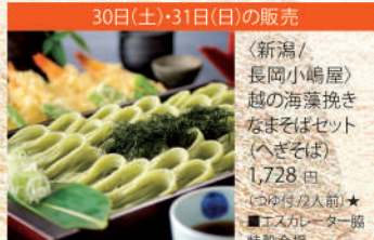
30日(土)・31日(日)の販売 〈新潟/長岡小嶋屋〉 越の海藻挽き なまそばセット (へぎそば) 1,728 円 (150g×2/2人前)★ ■エスガレーター一協 特設会場