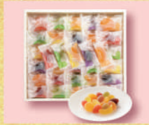
〈彩果の宝石〉フルーツゼリー コレクション 3,240 円(フルーツ ゼリー15種66個入) ■洋菓子