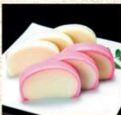
〈日本橋 神茂〉 御蒲鉾和燻 (紅・白) 各4,212円 (各280g/1本) ■食料品 催物場