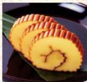
〈紀文〉 伊達巻 献上 60点限り 3,780円 (370g/1本) ■食料品 催物場