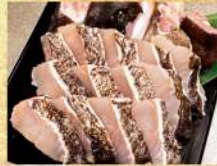
〈中島水産〉 長崎県産他 くえ鍋物用 12,800円 (約2～3人前)★