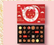
〈メリーチョコレート〉ファンシー チョコレート(お年賀) 40点限り 1,188 円(24個入) ■洋菓子