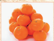
愛媛県産蜜なみかん 各日30点限り 1,944 円 (約2kg/1箱)★