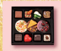
〈ゴンチャロフ〉ブーケドショコラ 2,160 円(11個入) ■洋菓子