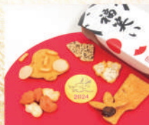
〈赤坂柿山〉 福笑い 1,296 円(6袋) ■和菓子