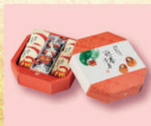
〈菓匠 清閑院〉迎春吉菓 1,296 円(福至たるまx4・お雛子x4) ■和菓子