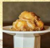
〈小布施堂〉 おせち鹿/子 置り売り 1,426円(200g) ※上記の商品は 12月29日(金)～ 12月31日(日)の 販売となります。 ■食料品催物場