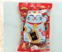
〈がんご私人〉福まねき揃 100高限り 1,080 円(240g) ■和菓子