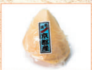
京都府産たけのこポイル 100点限り 1,080 円 (300g)