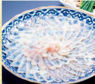
〈中島水産〉 長崎県産他とらふぐ刺身 3,999円(養殖/2人前)★ ●長崎県産他とらふぐちり鍋物用 5,599円(養殖/約2～3人前)