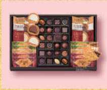
〈モロソフ〉 ロイヤルタイム 3,240 円(41個入) ■洋菓子