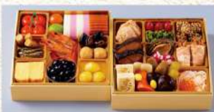
〈紀文〉桜春 ご予約30点限り 13,824円 (19.5×19.5×4.5cm×2/ 2～3人前/重箱:紙製) ■食料品催物場