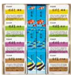
〈とらや〉夏小形羊羹・水羊羹詰合せ3号 4,752円(夏小形羊羹6点(『夜の梅』・『新緑』・『おもかげ』×各2点)、水羊羹8点(『御膳(こし餡)』・『抹茶』・『小倉』・『黒砂糖』×各2点)) □和菓子