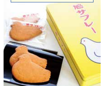
〈鎌倉豊島屋〉鳩サブレ 2,160円(16枚入) □ザ・ステージ#B1