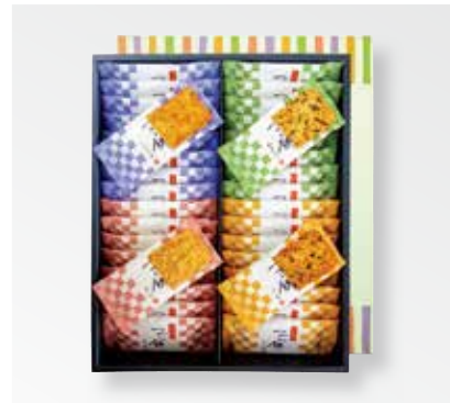
〈葵の倉〉うす揚げつづら餅 1,620円 (しょうゆ9枚、ごま9枚、えび9枚、刻みのり9枚) □和菓子