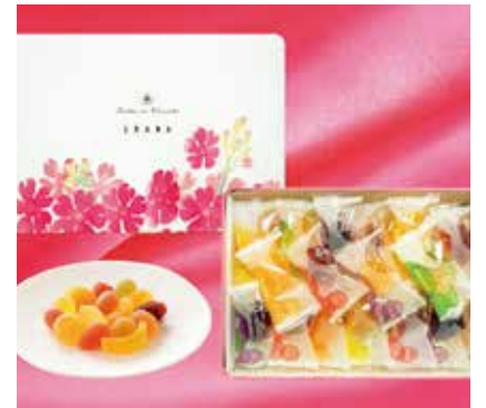
〈彩果の宝石〉[浦和地区限定] 浦和スーベニアコレクション フルーツゼリー 1,782円(28個入) □洋菓子