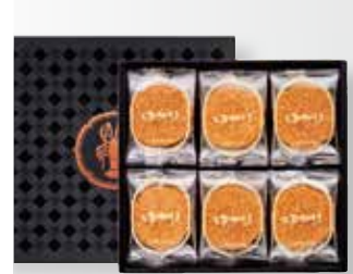
〈坂角総本舗〉 ゆかり 2,160円(24枚入) □和菓子