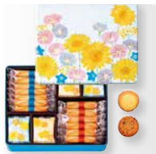
〈ヨックモック〉 カドードウレ 3,564円(4種/40枚入) □洋菓子