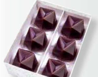
〈叶 匠壽庵〉 水羊羹6個入 2,160円(1箱) □和菓子