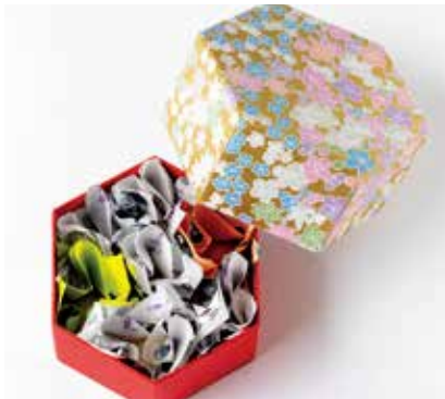
〈菓匠花見〉おさい箱7個入 1,323円(白鷺宝×5、玉しずく・茶ちゃ×各1) □和菓子