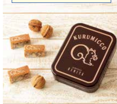
〈鎌倉紅谷〉クルミツキ10個入(缶) 2,160円(1個) □ザ・ステージ#B1