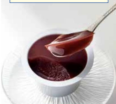
〈たねや〉本生羊羹 2,484円(6個入) □菓子プロモーション