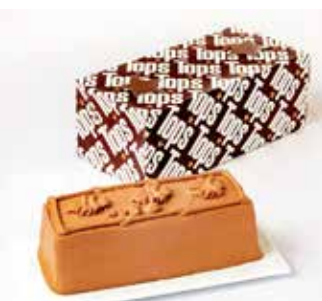
〈トップス〉 チョコレートケーキR 2,376円(1個) □洋菓子