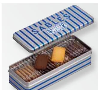
〈資生堂パーラー〉 サブレ 1,188円(ノワドココ・カカオ×各11枚) □洋菓子