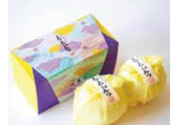
〈森八〉 葛あんみつ 1,350円(2個入) □和菓子