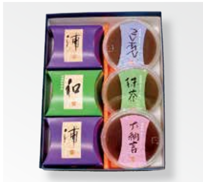
〈菓房はら山〉朝露セット 2,087円 (水羊羹(大納言・こし・抹茶)×各1、浦×2、和×1) □和菓子