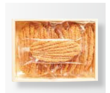
〈ウエスト〉 リーフパイ 1,512円(8枚入) □洋菓子

諸般の事情により、営業日・営業時間、予定していたイベントなどが変更、中止になる場合がございます。 必ず事前にホームページをご確認いただきご来店ください。伊勢丹浦和店のホームページはこちらから