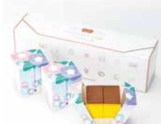
〈福砂屋〉 フクサヤキューブ 1,620円(5個入) □和菓子