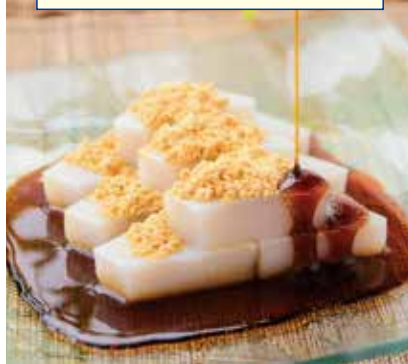
〈船橋屋〉くず餅 901円(24切入) □ザ・ステージ#B1