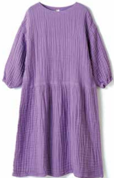
〈福岡/coton de mémé〉 ルームウェア ワンピース各種 10点限り 19,800円 (綿100%/フリーサイズ(M~L対応))