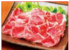
〈宮崎/桑水流畜産〉 黒豚切身し お一人さま2点 限り/各日30点限り 864円 (300g/1パック)