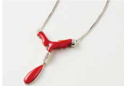
〈鹿児島/しぶし珊瑚〉 赤珊瑚デザインペンダント 1点限り 330,000円 (KI8WG・D:計0.077ct/トップ:約縦5.0×横3.0cm、チェーン長さ:約47cm)