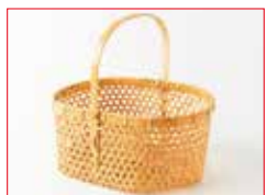
実演 〈大分/べっぶ竹細工もりぐち〉 亀甲手つきバスケット 3点限り 17,600円 (約27×28×22cm)