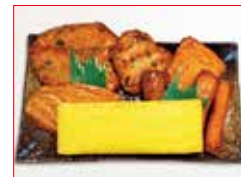
〈鹿児島/有村屋〉 さつま揚げ盛合せ お一人さま1点限り/各日50点限り 1,296円(1パック)