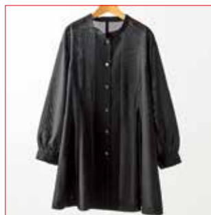
〈鹿児島/芭蕉産業〉 夏大島紬 ジャケットシャツ 1点限り 88,000円 (綿100%/フリーサイズ (M~L対応))