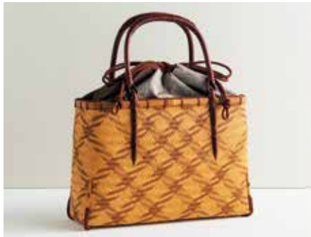
実演 〈大分/べっぶ竹細工もりぐち〉 鶴模様網代かごバッグ 1点限り 363,000円 (約34×29×10cm)