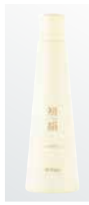
〈鹿児島/アーダン〉 初絹 ピュアレスト シルク ローション 7,150円 (120mL)