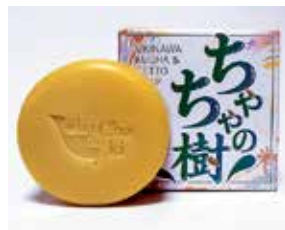
〈沖縄/樹れいや〉 ちやちやの樹石鹸 2,970円(100g)