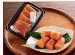
〈福岡/中島商店〉 お徳用辛子明太子 お一人さま2点限り/各日50点限り 1,080円(上切り/200g)