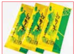
アプリ特典あり 〈鹿児島/おりた園〉 知覧茶深むし茶3本セット 100セット限り 1,080円 (100g×3)