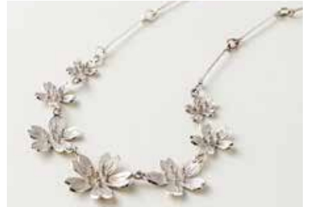
実演 〈福岡/津川貴金属工房〉 SAKURA ネックレス 1点限り 132,000円 (SV925/チェーンの長さ:約42cm(アジャスター6cm付))