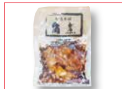
〈長崎/ふくみ屋〉 きざみ角煮 各日50点限り 1,080円(冷凍/120g×4個)