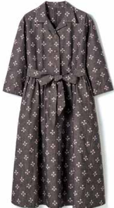
〈福岡/わの葉〉クラシカルワンピース 梅鉢 1点限り 105,600円(綿100%/フリーサイズ(M~L対応)) ※他にも色柄違いがございます。