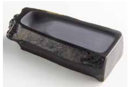
実演 〈鹿児島/秀命堂〉屋久島硯各種 3点限り 49,500円(天然石(水岩)/約幅8×奥行16×高さ4cm) ※画像の商品は現品限りです。