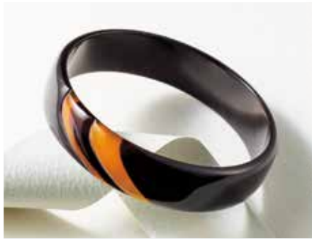
実演 〈長崎/べっ甲屋たがわ〉 べっ甲プレスレット 1点限り 132,000円 (約幅1.5×全長22cm)