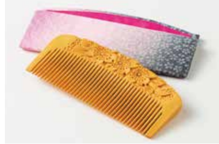
〈鹿児島/喜多つげ製作所〉薩摩つげ櫛 桜柄(手作り布 ケース付) 3点限り 14,300円(つげ材(鹿児島県産)/ 約9.5×4.5cm) ※画像の商品は現品限りです。