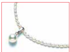
〈大分/オーハタパール〉 淡水パールネックレス (アコヤ真珠トップ付) 10点限り 11,000円(トップ:6.5mm玉、 その他:2mm玉/SV/長さ:約42cm)