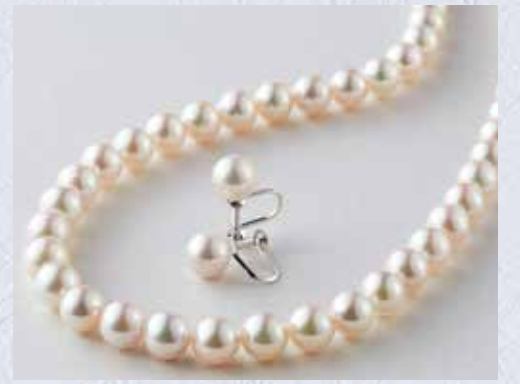
〈大分/オーハタパール〉 アコヤ真珠ネックレス・イヤリングセット 1セット限り 330,000円(ネックレス:7.5mm玉/SV/長さ約42cm、 イヤリング:8.0mm玉/KI4WG)