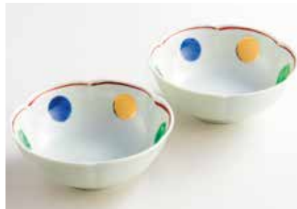
〈佐賀/貴陶〉 【観山窯】錦丸紋小鉢 15点限り 各2,200円 (約径12.5×高さ5cm)