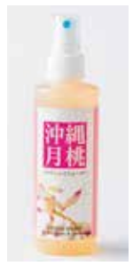
〈沖縄/日本月桃〉 シマ月桃 ウォーター 2,420円 (200mL)