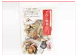
〈大分/大分一村一品〉 どんこ 100点限り 999円 (100g)