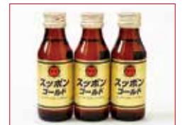
アプリ特典あり 〈大分/塚崎スッポン 本舗〉スッポンゴールドドリンクセット お一人さま1セット限り/各日10セット限り 1,296円(100mL×3)