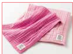
〈福岡/coton de mémé〉 バスタオル&ポディタオルセット 各種 15セット限り 7,150円 (綿100%/バスタオル:約67×121cm、 ポディタオル:約32×78cm)