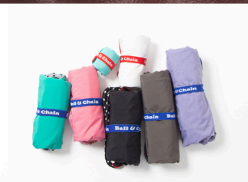
2月26日(水)～3月11日(火) 〈Ball&Chain〉ワフマイルバッグ

※ご購入・ご購入についての詳細は、決定次第伊勢丹浦和店公式ホームページにてご案内いたします。