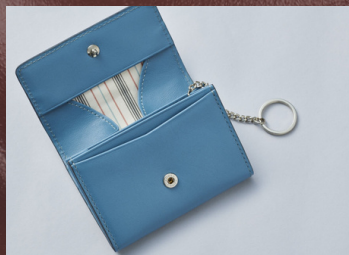
2月12日(水)～2月18日(火) 〈Fico〉 〈airlist〉 ハンドバッグ / 財布 / 革小物