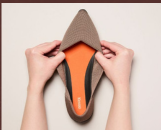
2月5日(水)～2月11日(火・祝) 〈Kesou〉 レディースシューズ