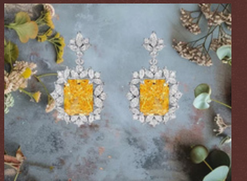
2月12日(水)～2月18日(火) 〈DreaMer.〉 アクセサリ / ジュエリーボックス