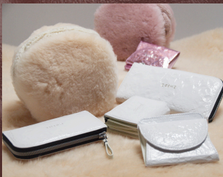
2月5日(水)～2月11日(火・祝) 〈muku+CRÈME〉 ハンドバッグ / 財布 / 革小物