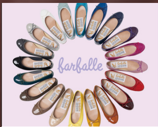
1月29日(水)～2月4日(火) 〈farfalle〉 レディースシューズ