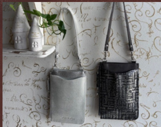
1月29日(水)～2月4日(火) 〈Mano da Mana〉 財布 / 革小物

※ご購入・ご購入についての詳細は、決定次第伊勢丹浦和店公式ホームページにてご案内いたします。