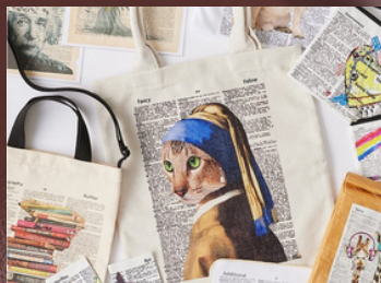
2月12日(水)～2月18日(火) 〈ARTNWORDZ〉 ポップアートプリント雑貨