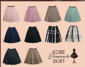
1月29日(水)～2月4日(火) 〈TRECODE〉 山の手スカート 他