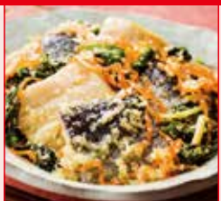
〈寿都町/山下水産〉 菜の花にしん黒酢和え 50点限り 1,181円 (200g)