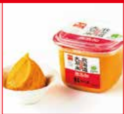
〈千歳市/岩田醸造〉 紅一点無添加みそ 紅ラベル 416円 (500g)