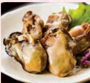
〈寿都町/山下水産〉生きた牡蠣 甘露煮 1,981円 (100gあたり)