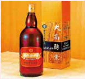
〈小樽市/大高酵素〉 スーパーオタカ 8,640円 (1,200ml)