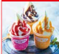
〈札幌市/札幌みるくはうす〉 おうちで食べるお持ち帰り用 ソフトクリーム6個セット 50セット限り 1,951円 (1セット)