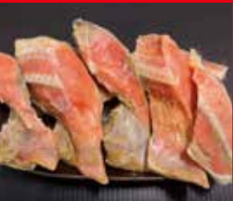
〈根室市/鮭匠ふじい〉 塩紅鮭切落し お一人さま1点限り/ 30点限り 1,080円(500g)