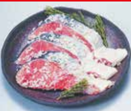
〈札幌市/佐藤水産〉 北海道産秋鮭さざ浪漬 50点限り 1,080円(3切)