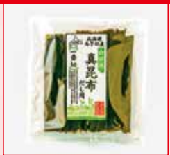
〈函館市/南かやべ漁業 協同組合〉 一等検真昆布だし一番切 486円 (50g)