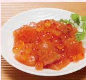
〈札幌市/佐藤水産〉鮭ルイベ漬 2,268円(160g)