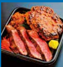
〈函館市/やきにくれすと らん沙蘭〉牛ステーキ・ ハンバーグミニ弁当