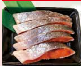
〈札幌市/海光〉塩紅鮭 お一人さま1点限り/50点限り 1,080円(5切)