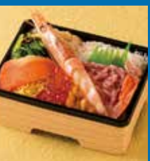
〈札幌市/北海工房〉 姫海鮮