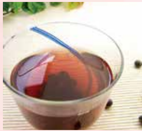
〈旭川市/三葉製菓〉 北海道黒豆茶 2,916円(600g)