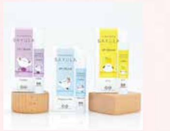
3月10日(火)までの販売 〈千歳市/北海道純馬油本舗〉 バユラリップクリーム 限定しまえながデザイン (ハスリップ・無香料・ゆず) 各1,210円(3.5g)