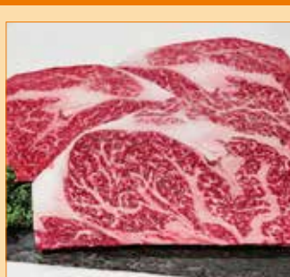
〈イセタンミート〉 北国育ち牛 サーロインステーキ用 50点限り 1,480円(150g/1枚)