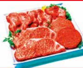
〈イセタンミート〉かみふらの和牛 スペシャルセット お一人さま1セット 限り/各日50セット限り 5,400円 (1セット)