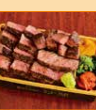
〈函館市/やきにくれすとらん 沙蘭〉肉盛りステーキ弁当 20点限り 2,700円(1折)