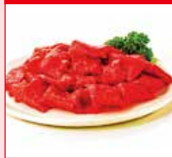
3月10日(火)までの販売 〈イセタンミート〉北国育ち牛 切り落し各日100点限り 1,380円 (250g)