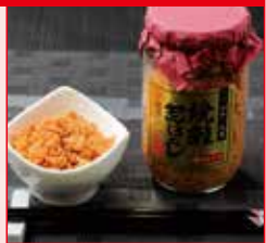
〈函館市/山丁長谷川 商店特価市〉 焼鮭荒ほぐし 900円 (180g)