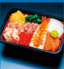
〈札幌市/市場めし 兆〉 味くらべ弁当