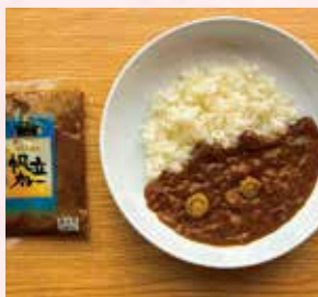
〈札幌市/キッチンアクティブ〉 帆立カレー 756円 (180g)