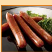
〈札幌市/春雪さぶーる〉 あらびきウインナー 20点限り 594円 (105g/1パック)