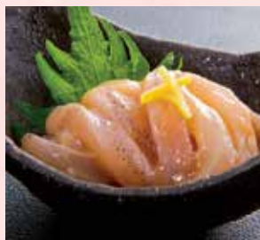
〈函館市/味の匠〉匠の塩辛 891円 (100gあたり)