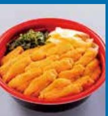
〈余市町/うに専門店 世壱屋〉 半生うにめしハーフ

※数に限りがございますので、品切れの際はご容赦ください。※ご来店の方に限りさせていただきます。※MI Wメンバーとは三越伊勢丹アプリをダウンロードいただき、エムアイカードを連携した名称のことで、エムアイカードとはエムアイポイントが貯まるクレジットカード(エムアイカード プラスなど)の総称です。