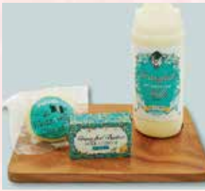
〈西興部村/ミルクデザイン〉 モツァレラチーズ 810円(100g) グラスフェッドバター 1,923円(100g) 牛乳 1,296円(900ml/1本)