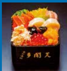
〈札幌市/多聞天〉 海鮮ミニちらし

MI Wメンバー、または新規にエムアイカードと三越伊勢丹アプリをご連携いただいたお客さま限定