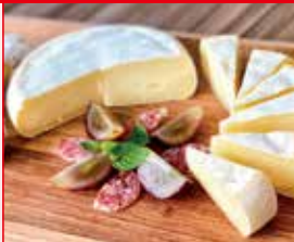
〈フロマージュ・ドール〉大地の ほっぺ MINI (NEEDS) 30点限り 1,269円 (180g)