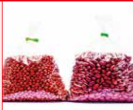
〈夕張市/夕張あきんど屋〉令和 7年度産大納言小豆・大正金時 各60点限り 各1,512円(各1kg)