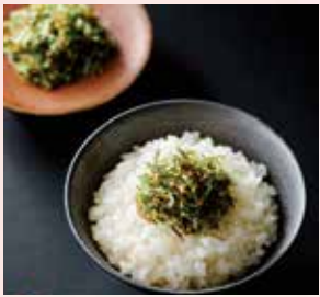
3月11日(水)からの販売 〈小樽市/木の屋〉 日高昆布ちりめん 1,620円 (160g/1袋)