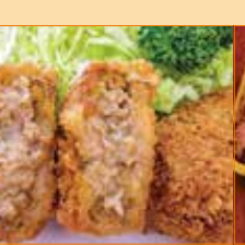
〈函館市/マルヒロ太田食品〉 函館メンチカツ4個セット 50セット限り 1,080円