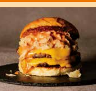
〈札幌市/エッセンサッポロ〉 道産牛ダブルチーズバーガー 50点限り 1,296円 (1個)