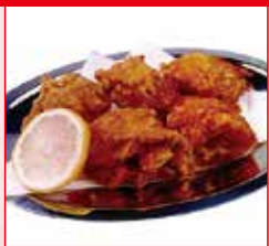
〈小樽市/なると屋〉 ざんぎ5個セット 30セット限り 751円 (1セット)