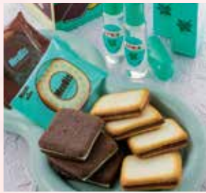
〈北見市/北見ハッカ通商〉 ハッカ油スプレー 1,188円 (11.5ml) メンビス 972円(12枚入)