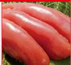
〈札幌市/海光〉塩たらこ お一人さま2点限り/ 50点限り 1,080円 (250g)